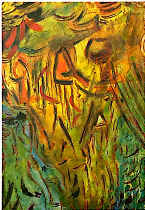
Primo chakra (terra) , 1996-97, acrilico e olio su cartoncino 70 x 100 cm