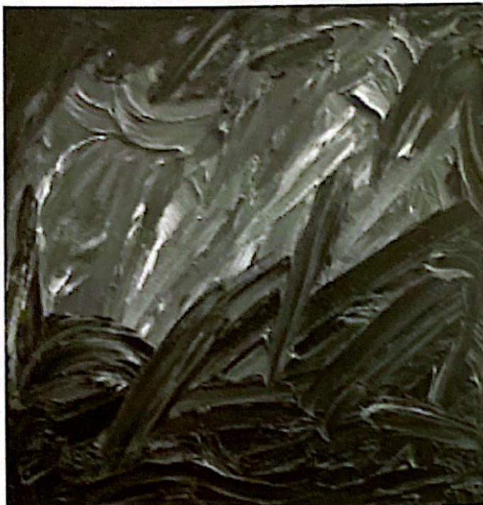
SENZA TITOLO - dal tema CAOS (2006) NO TITLE - from the CAOS theme (2006)