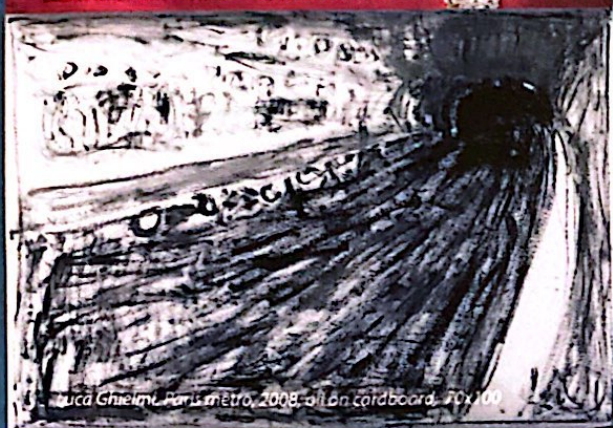
Luca Ghielmi, Paris metro, 2008, olio su cartoncino, 70x100