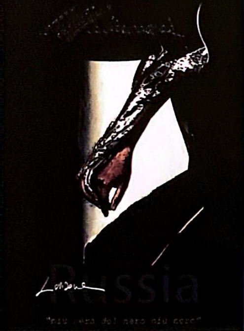
Lovisone "niu nero del nero niu nero"