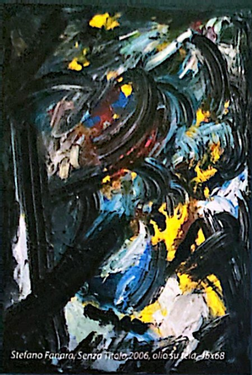
Stefano Fanara, Senza Titolo, 2006, olio su tela, 15x68