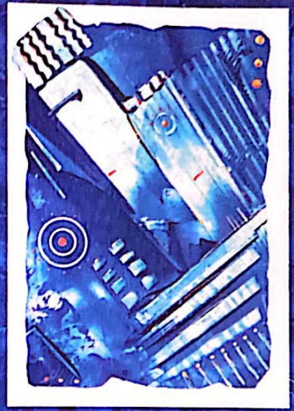
Varrè, Verso l'alto, 2007, acrilico su legno, 66x86