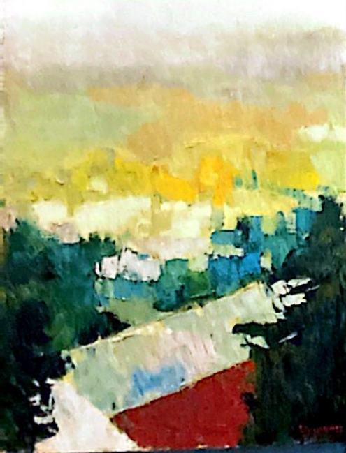
Stefano Ballantini, Paesaggio, 1998, olio su tela, 100x70cm