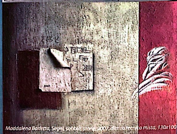
Maddalena Barfetta, Segni, sabbia, storia, 2007, olio e tecnica mista, 130x100