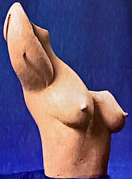
Lietta Morsiani, Frammentato, 2007, 35x25x25