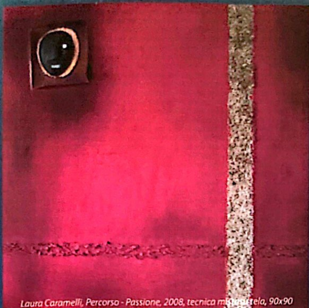
Laura Caramelli, Percorso - Passione, 2008, tecnica mista su tela, 90x90